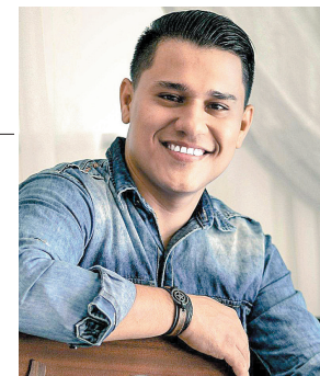
(104 Sul), a partir das 20 horas. Informações: 98462-1079.